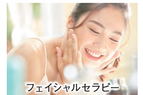
フェイシャルセラピー